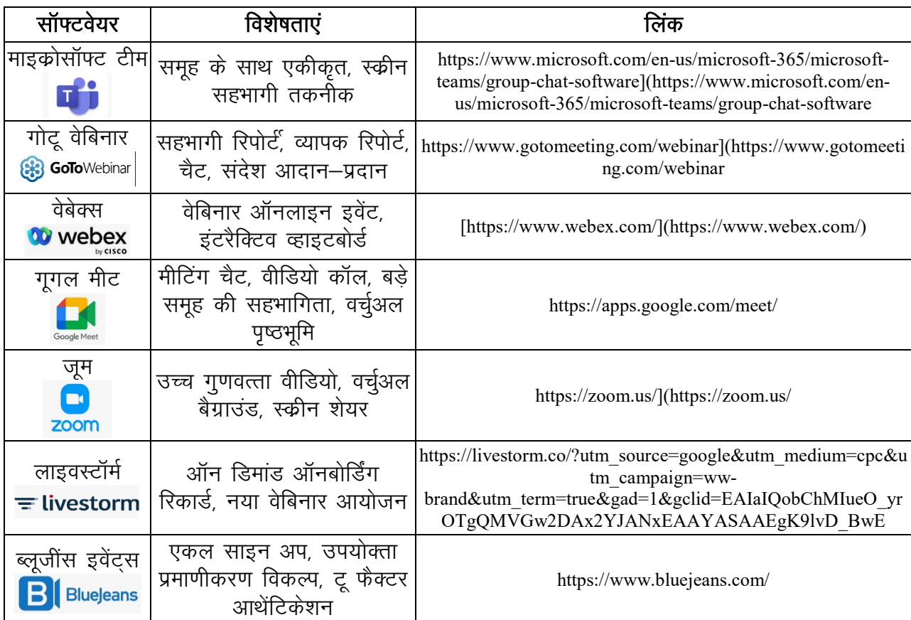
तालिका 1: वेबिनार आयोजन हेतु प्रमुख सॉफ्टवेयर।

ब्लूजींस इवेंट्स: एक वेबिनार और ऑनलाइन इवेंट्स को आयोजित करने के लिए एक वीडियो कॉन्फ्रेंसिंग प्लेटफॉर्म है। यह व्यक्तिगत और व्यापारिक उपयोगकर्ताओं के लिए डिजाइन किया गया है ताकि वे वेबिनार आयोजित कर सकें और व्यापारिक समर्थन, प्रस्तावना, प्रश्नोत्तरी सत्र आदि के आयोजन कर सकें। इन उपकरणों से ऑनलाइन वेबिनार का आयोजन कर सकते हैं और अपने उपयोगकर्ताओं के साथ ज्ञान, संवाद और अनुभव को साझा करते हैं।